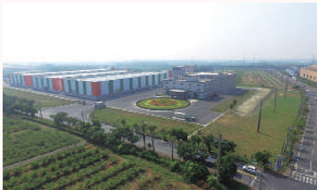
(左) 南六台灣總公司。 (右) 南六平湖廠區空拍。