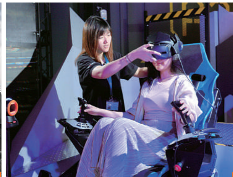
1_ 智崙資訊旗下產品 i-Ride 飛行劇院目前市占率全球第一，以卓越品質席捲國際市場。2_ 走在全球體感科技市場尖端的智崙資訊，為海外各大主題樂園及觀光景點的首選合作廠商，圖為去年（2019）打造的冰島飛行劇院 FlyOver Iceland。3_ 除了飛行劇院，智崙資訊也將觸角伸及電競產業。