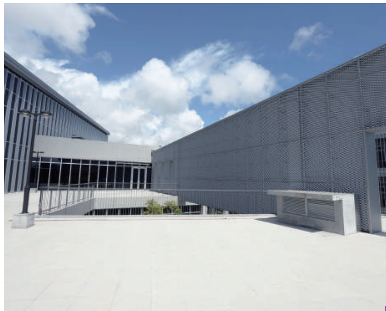
1_ 上鎧鋼鐵菱形的金屬擴張網於行政院農業委員會屏東農業生物科技園區之應用。2_ 高雄捷運的天花板，運用上鎧鋼鐵的菱形金屬擴張網，包裹整個捷運站裡重要的工程管線。3_ 高雄立圖書館草衙分館入口旁的戶外造型牆面採用上鎧鋼鐵研製的獨立裝框設計，呈現外型輕盈、線條流暢的金屬網牆面。