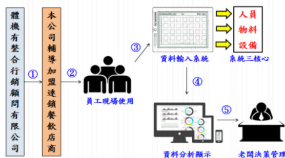
本「銷售計畫資訊系統」與服務模式使用情境

本系統上市至今，已達成5家客戶購買本系統，並簽訂合約完成，目前銷售金額達150萬元，就公司未來獲利預估而言，本「銷售計畫資訊系統」未來將採「賣斷型收費」與「月租型收費」兩種，前者「賣斷型收費」主要銷售於加盟總店，每套售價15萬元，每年預計可販售10~30家加盟總店，獲利約數百萬元；「月租型收費」主要租給加盟店商，提供數個店商經營精簡模組，每家每月費約1,200元，每年可獲利百萬多元。