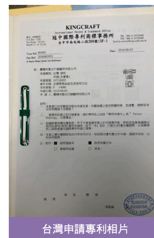
台灣申請專利相片