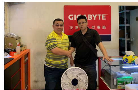
沛羽負責人與宇盛公司林董事長簽約合照