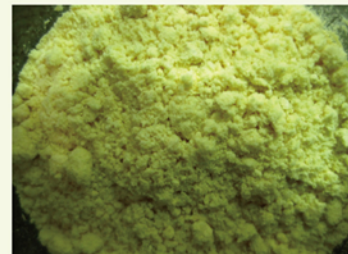
▲本計畫研發之產品照片