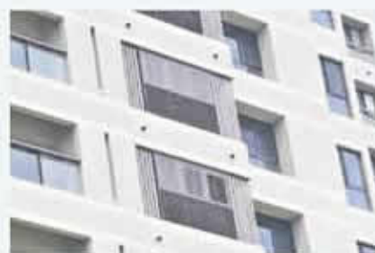
▲甫交案之輕質戶外型鋁百葉窗，可開啟不同的角度