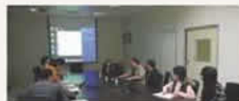
▲研發團隊開會討論

本公司希望將累積多年之肉品知識及調理經驗透過數位化方式、系統性、多元化的管道提供給消費者，以利後續能建立觀光工廠提供給更多的消費者對於肉品認知與掌握。