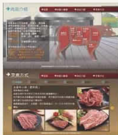
▲肉品知識數位資料庫

建置肉品知識數位資料庫以使用者之閱覽舒適性、查詢操作便利性、料理食用健康等作為資訊建立之優先考量，希望以3D擬真技術介紹肉品知識。