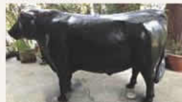
▲實體牛模型，並將結合肉品數位化內容