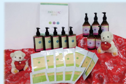
▲本計畫研發之洗髮精、潤絲精及染髮粉。