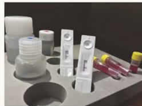
▲肺結核快速檢測套組，包含樣品前處理試劑、核酸擴增試劑與檢測試片。