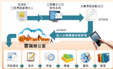
▲商工電子公文收文流程示意圖