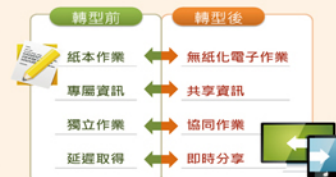
▲「商工電子公文企業收文流程自動化服務」導入前後之比較