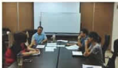
▲研發人員專案會議

感謝委員們在這次專案中的指導及建議，和各協力廠商的多方面配合，讓這專案圓滿達成，在研發過程中，雖然團隊遇到不少挫折，與意見上的衝突，但大家都努力面對並加以克服，相信這次研發過程是本公司最寶貴的經驗。