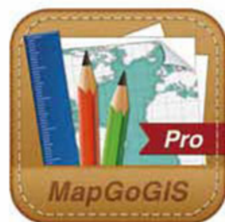
MapGo GIS 產品 Icon

世穎資訊是一間充滿活力的公司，我們主要研究開發網際網路之地理資訊系統軟體，整合專業圖資與行動化地圖元件，依照使用者的需求提供最佳解決方案。近年來因應行動化潮流來臨，我們的產品應用從辦公室之瀏覽器延伸至戶外，適用於不同的行動裝置中，如 Smartphone、Tablet 等，不僅加快使用者的工作效率，同時滿足應用上不同的需求。