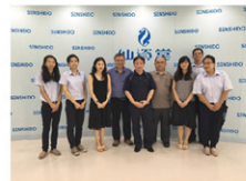
▲公司研發團隊合照

本計畫採用之黃芩來自花蓮農場，本次研發團隊對其根、莖、葉萃取及分析，作成一系列化粧品，隨後三年規劃每年都會有相關產品上市，感謝高雄市政府經濟發展局補助本計畫研發經費，資策會亦多次教導計畫內容之撰寫，才得以計畫順利完成。