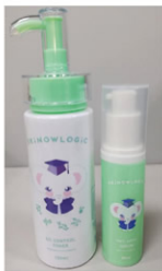
▲以黃芩萃取物之乳酸菌發酵產物及黃芩精油所研發調製之抗痘化粧品保養品 (左:控油化粧水, 右:高效抗痘精華)

黃芩具多種生理活性，有較佳抗菌與抗發炎活性，因此本計畫將黃芩乳酸菌發酵物及其精油應用於化粧品之研發，並驗證其抑菌能力，透過降低防腐劑的使用量，減少產品對皮膚的刺激過敏性，此乃本計畫創新之處。