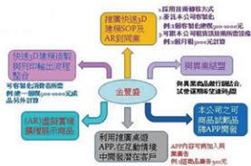
▲計畫創新及獲利方式

本計畫創新重點為建立一個金銀珠寶飾品的商務服務流程，透過珠寶飾品之3D快速建模，降低模型建置成本，並搭配3D數位展示商務平台，消費者在此平台上可自行調整商品之各項規格或外觀，完成客製化商品，再由3D列印機印出商品雛型，送交消費者確認與購買，即可完成交易流程。