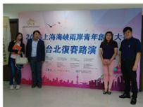
▲公司研發團隊參加兩岸青年創業大賽視察合照

創新研發是一條辛苦漫長的路，尤其對傳統產業及服務性質產業而言，在現今市場競爭下，傳統產業必須轉型找出自己的路，本公司在高雄市地方型SBIR支持之下，找出傳統銀樓產業的一條新道路。雖然目前只是開始，但令本公司雀躍不已，創新和研發一直是這產業先前不曾想過的，如今能夠實行，對本公司是莫大的鼓勵，未來本公司將持續精進，讓創新繼續為銀樓產業帶來新契機。