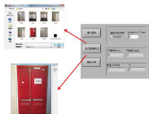
▲使用者透過網路上傳門窗照片，由系統進行影像辨識及報價