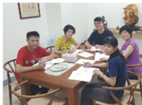
▲公司研發團隊合照

近年製鞋產業面臨極大挑戰，所幸有中央及高雄市政府提供政府資源，使本公司有更充裕的研發經費投入產品研發。審查委員的建議及鞋技中心的協助，也是本計畫成功的關鍵因素之一；計畫期間委員對計畫的督促與要求、技術上的建議及鞋技中心各項資訊的協助，使本公司得以在最短時間及有限經費的情況下，有效率的完成計畫，並獲得具實質效益之成果。