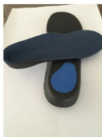
▲具有壓力擴散效果之鞋墊