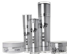
▲ 黑耀肌-黑木耳樟芝萃取保養組