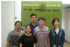
▲ 公司研發團隊合照

本計畫研發過程中，透過與嘉南藥理科技大學粧品系合作，開發出黑木耳的機能性原料，並與台灣珍寶牛樟芝作結合，調配出獨特的系列保養品，在技術上是一大突破也更上一層樓。公司參與本計畫的過程不僅學習到許多寶貴的經驗，也希望將這次經驗運用在產業與社會上，期能在保養品界帶來一股新風潮，將台灣推上國際舞台並與國際美容市場競爭。