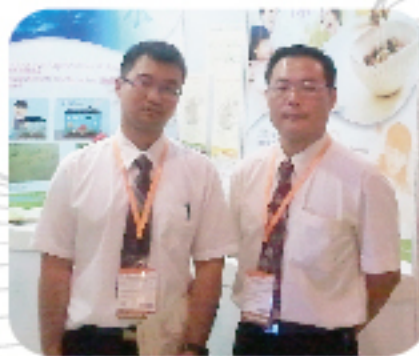
公司研發人員合照

本計畫執行最大的困難點在於「如何整合學術研究者之專業意見至實際生產製程的客觀限制條件。」以在實際生產過程中，許多培養基不易取得且成本過高，或實驗操作太過繁複等諸多限制，使得最後的配方並不是實驗室所測試最完美的條件，但卻是綜合各項成本與條件之最可行策略。總結來說，生技產品研發並非是一味追求最完美的狀態，能否利用有限的資源並隨時保持最大之彈性以因應各種狀況和需求，實為成敗與否之重要關鍵。