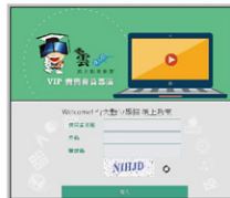
▲數位學習平台示意圖