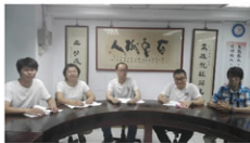
▲計畫研發團隊合照

台大數位因高雄市政府地方型SBIR的肯定，完成台大數位首創產品，提升雲端平台技術，讓學習者可藉由行動裝置學習，增加購買課程意願，對公司而言，業績呈現正成長，除N3/N4課程外，本產品推廣亦帶動其他護理相關課程的銷售，後續將持續透過各合作夥伴，平台商推廣以取得佳績。