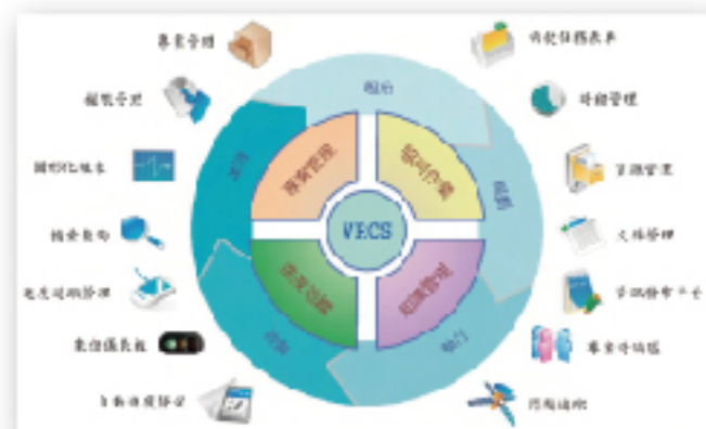
VRCS可包含專案管理、協同作業、進度追蹤及知識管理