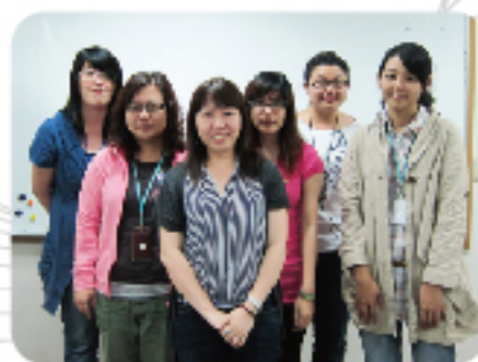
公司研發團隊合照

很感謝高雄市政府提供這樣的機會，讓我們能夠加速發展行動領域市場，這一塊是未來的兵家必爭之地，有了補助之後，我們更能無後顧之憂的進行發展，讓公司雖然位於南部，但也能夠擁有政府資源與和北部同業進行競爭。在執行的過程中，研發團隊學習到最寶貴的經驗就是專案時程之掌握，事前的規劃與執行中的問題解決都是影響執行成果的關鍵因素。同時，管理階層團隊不斷協助團隊解決各項問題，終於邁向成功。