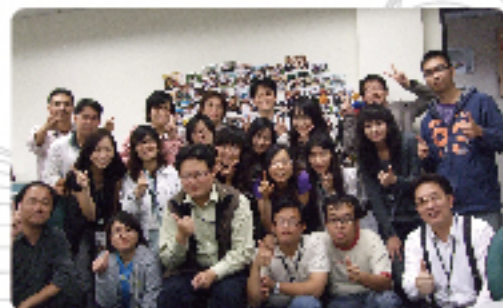
公司研發團隊合照

在研發過程中，研發團隊獲得許多寶貴經驗，如：雲端通訊電話軟體，除考量是否能夠撥通，還需評估通訊設備之頻寬狀況，解決相關問題。一等一科技以開發辦公室自動化軟體為主力，再加上本計畫的雲端通訊功能，使公司以外的環境也可隨時直接和客戶通話，讓企業主在經營管理上如虎添翼。未來我們也將持續把本計畫產品和品牌推向國際舞台，發揚台灣軟實力。