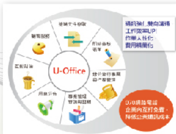
雲端辦公室通訊創新提升生產力示意圖

本計畫重點為建立雲端辦公室通訊軟體服務，讓辦公室的觀念可以延伸至公共場所，建構一個更便利的網路存取環境，使商務人士可以隨時隨地的處理公務，進而提高生產力、增加投資報酬、節省成本，幫助企業帶來巨大的效益。