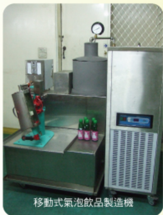
移動式氣泡飲品製造機

台灣坊間常見許多泡沫紅茶及搖茶的飲料攤，尤其南部天氣炎熱，更是常常見到人手一杯飲料。然而，目前飲料攤皆是將調理器皿拿在手上或是利用調理機作激烈的搖拌使其均勻，調製成一杯清涼解渴的冰飲，其雖有調製過程迅速、口味多樣及方便攜帶之優點，但是當下在飲料攤調製之飲料中，卻非常少見碳酸飲品。雖部分飲料攤雖有販售調製之汽水，卻為罐裝汽水額外加冰塊搖拌調製而成，以此種方式調製容易喪失二氧化碳，造成口感較差，也缺少汽水在當下開瓶時，二氧化碳飽滿溢出之暢快感受。因此，本計畫希望能研發移動式氣泡飲品製造機，將碳酸汽水可在任何場所製造出。研發完成後，則可循藉茶飲店之設立門檻低、人力需求低的小型經營模式，造就另一番創業之新風潮。