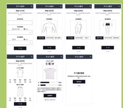
使用「尺寸小幫手」獲得系統分析尺寸建議