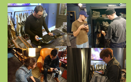
顧客運用「尺寸小幫手」將結果上傳分析