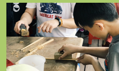
旅客體驗檜木筷製作