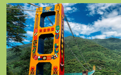
深入社區介紹在地美景