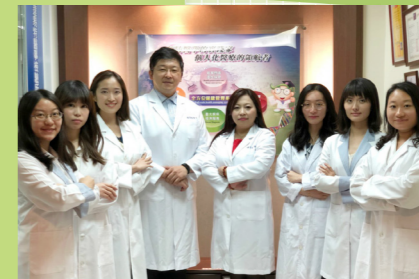
達易特基因科技研發團隊合照

感謝高雄市地方型SBIR計畫補助，也感謝市政府、審查委員、計畫辦公室人員協助。期許達易特能透過整合性規劃，帶動各項產業的發展，提高人民生活與健康水平，並促進產業價值提升，達到「人人都健康，人人都樂活」的終極目標，進而成為全球最大規模精準生活集團。將此最有發展潛能的健康產業，升級為精準生活產業，與世界同步接軌。