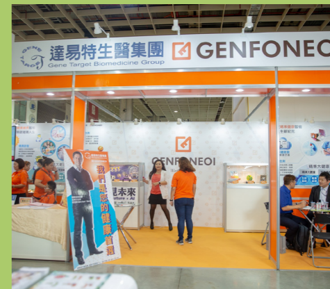
參與 2018 年生物科技大展