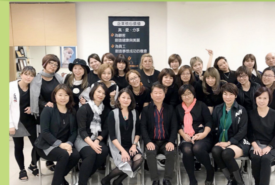
方中至董事長與參與本專案同仁合影

AI及電子時代已經來臨，許多消費需求可透過網購，而美容美髮業最大的優勢就是顧客仍會至實體店面進行消費，因此如何讓顧客保持新鮮感、安全感及信賴感，勢必得有不不斷創新的商業服務模式，即使打穩根基後仍應不斷追求創新服務，這也是以人為本的時尚產業所必須積極努力的方向。