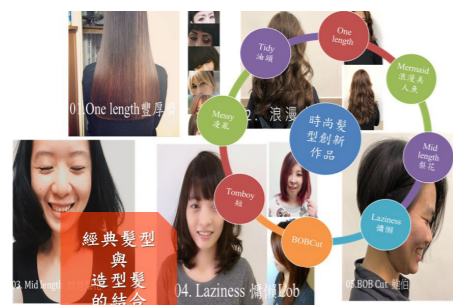
麗髮型時尚髮型創新作品