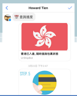
系統前台畫面 - 聊天中就完成訂單