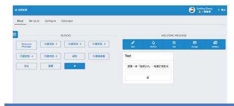
系統後台畫面 - 設定對話流程