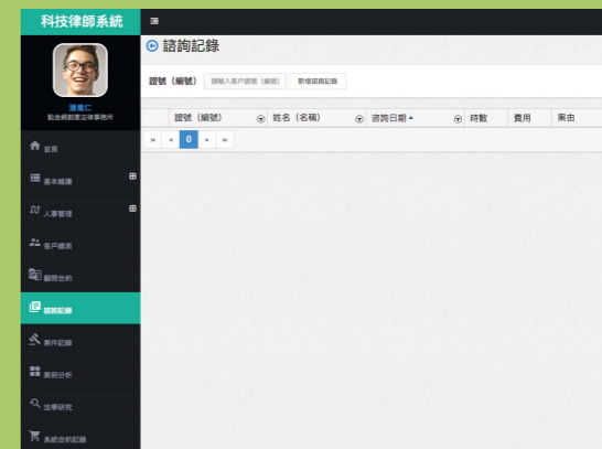
建立到所諮詢之系統畫面