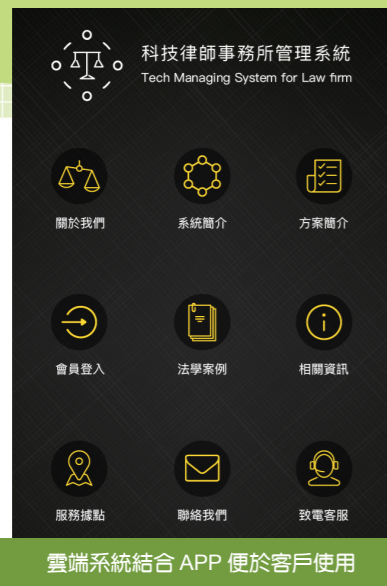
雲端系統結合 APP 便於客戶使用