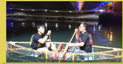
組合獨木舟航行愛河