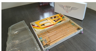
組合獨木舟零件一覽